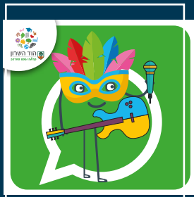
עדכוני תרבות ואירועים