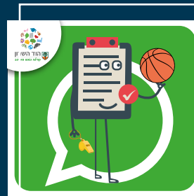
עדכוני בריאות, ספורט, קיימות ואיכות סביבה