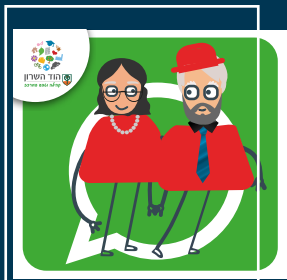
עדכוני ותיקות וותיקים +60