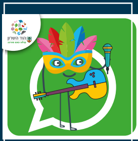
עדכוני תרבות ואירועים