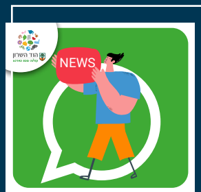
English Speakers Hod Hasharon