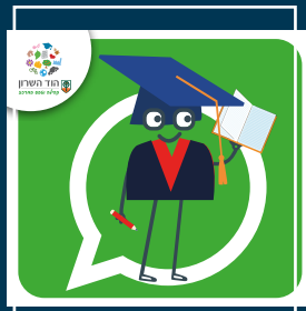
עדכוני מערכת החינוך