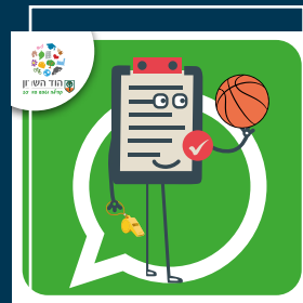
עדכוני בריאות, ספורט, קיימות ואיכות סביבה