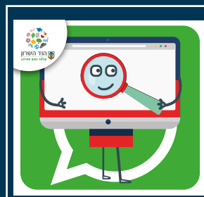
עדכוני דרושות.ים בעיריית הוד השרון