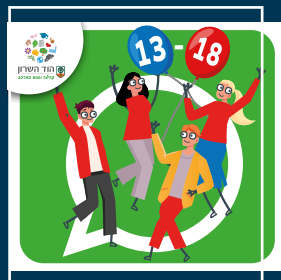
עדכוני נוער (13-18)