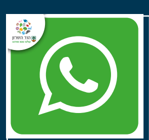
עדכונים ישירים מהעירייה בוואטסאפ בכל התחומים