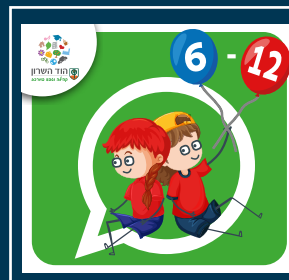
עדכוני ילדות וילדים (6-12)