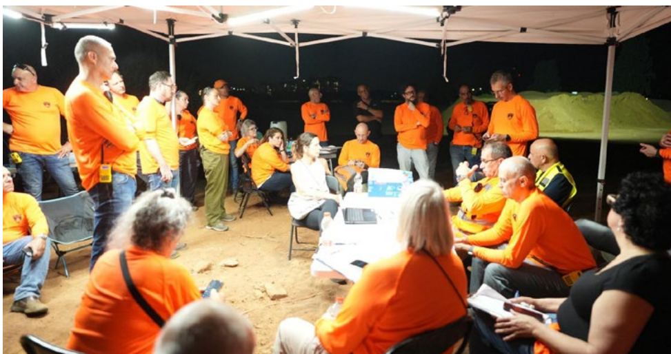
בתמונה: יחידת החילוץ העירונית בתרגול