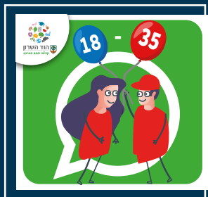
עדכוני צעירות וצעירים (18-35)