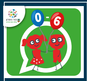
עדכוני הגיל הרך (0-6)